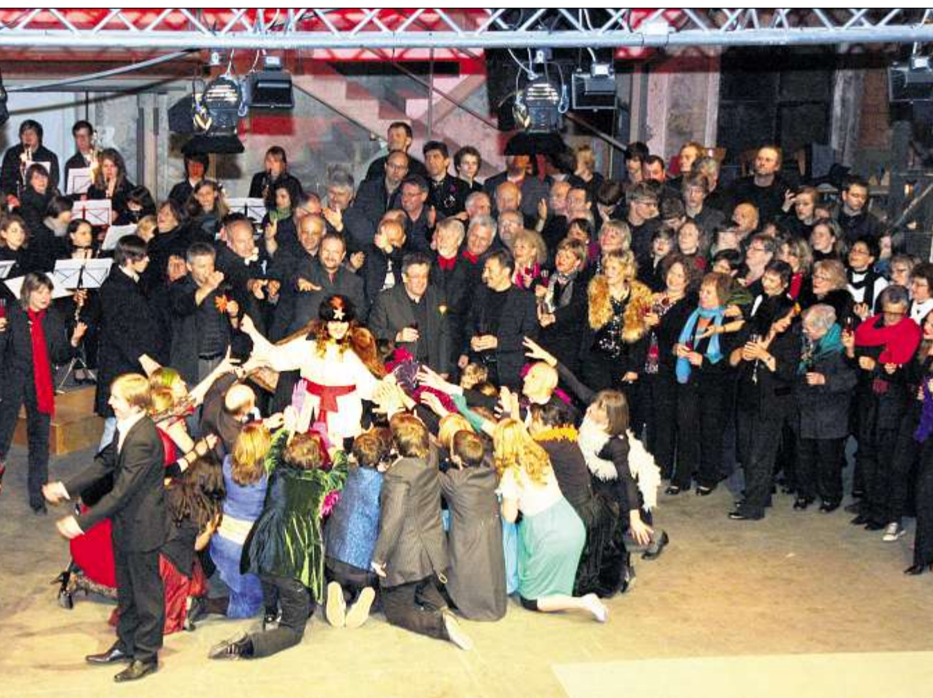
GROSSARTIGE BÜHNENLEISTUNG: Mehr als 300 Mitwirkende setzten „O Fledermaus“ als imponierendes Gemeinschaftsprojekt in der „Heckel“ eindrucksvoll in Szene.